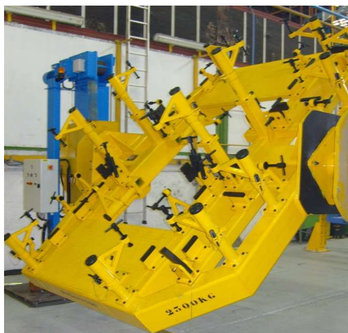
Outillage conçu pour un client du secteur automobile