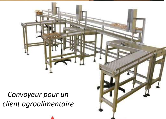
Convoyeur pour un client agroalimentaire