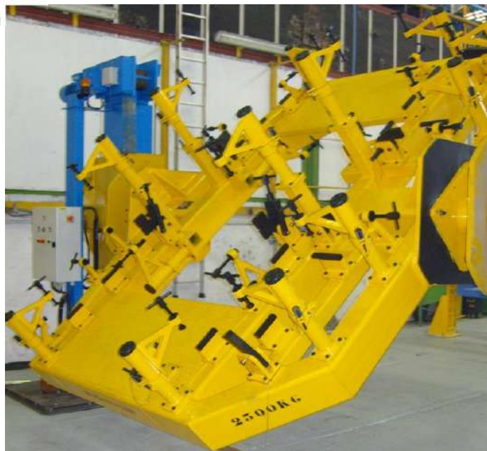
Outillage conçu pour un client du secteur automobile