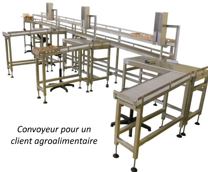
Convoyeur pour un client agroalimentaire