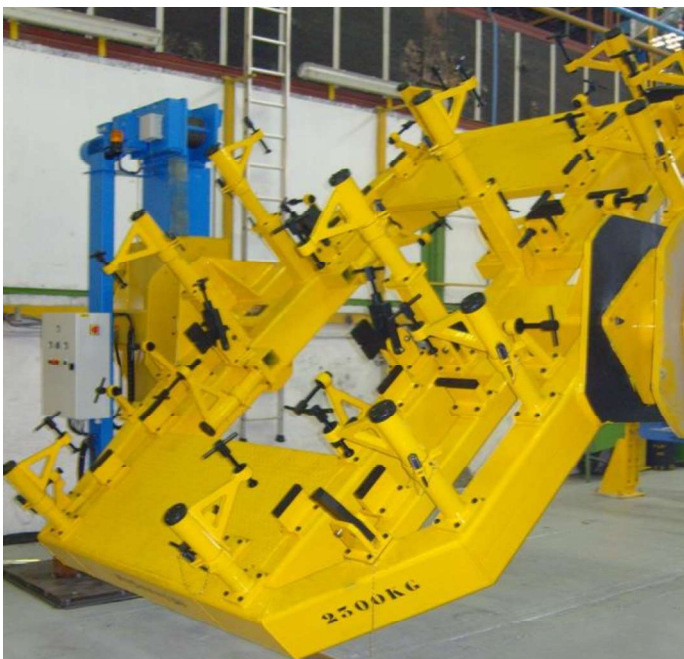
Outils conçus pour un client du secteur automobile